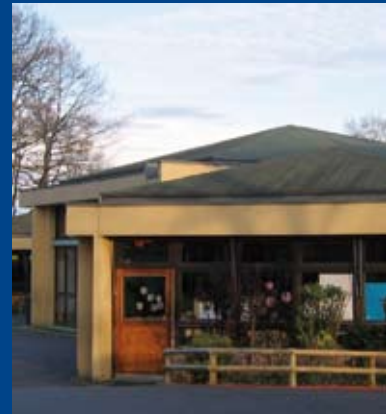
L'école des Hauts-Bâtons.

À partir de janvier et jusqu'en juin, Emmaüs Habitat et l'équipe pédagogique de l'école des Hauts-Bâtons proposent aux élèves de deux classes (CE2 et CM1/CM2), de travailler avec l'association Mille et une Ville sur le thème de l'énergie. Ce programme d'actions permettra aux enfants de prendre conscience de la nécessité de réduire nos consommations et de s'engager à l'école, mais aussi avec leur famille, à devenir économes.