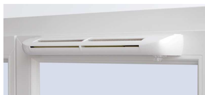
Exemple d'une entrée d'air