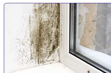
Ci-dessous : apparition de moisissure sur les murs lorsque les entrées d'air des fenêtres sont bouchées