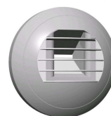
Exemple d'une bouche d'extraction