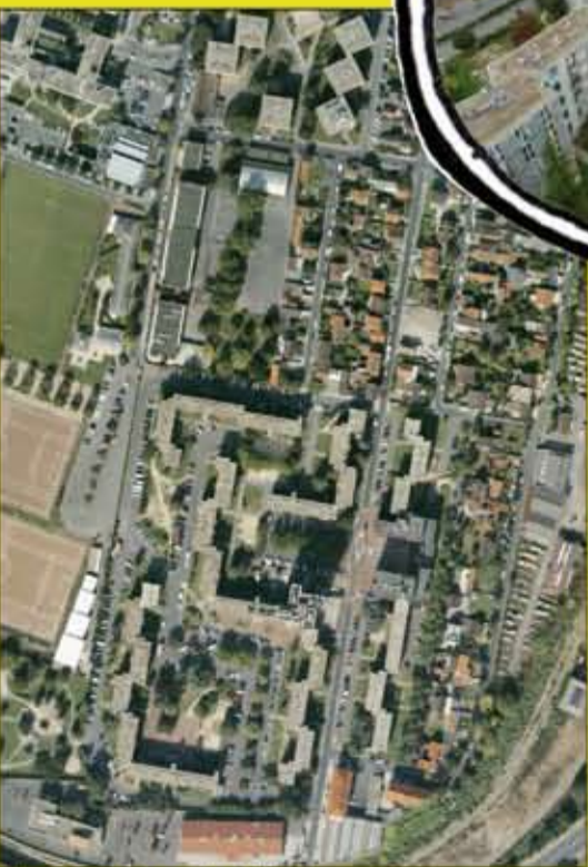
Vue aérienne du quartier de l'Étoile