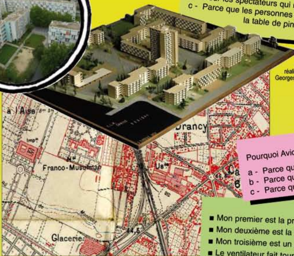
La carte de Bobigny et des villes alentours en 1944.

Quizz : Pourquoi y-a-t-il des chaises sous la table de ping-pong ? a - Parce que les habitants se réunissent pour jouer à la chaise musicale. b - Pour les spectateurs qui regardent les matches de ping-pong. c - Parce que les personnes âgées ont l'habitude de jouer aux cartes sur la table de ping-pong.