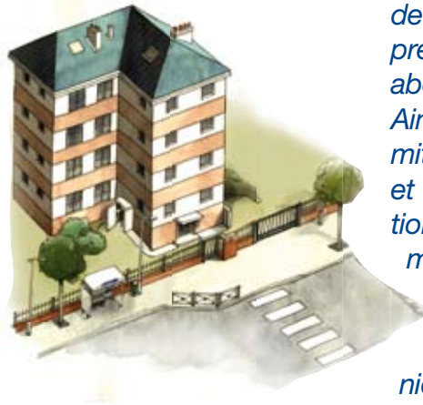
Exemple de résidentialisation.