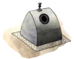
Exemple de borne enterrée.

En 2012, des points de collecte définitifs, sous forme de bornes enterrées cette fois, seront installés sur le site à proximité des plateformes temporaires. Ces bornes enterrées offrent de nombreux avantages :