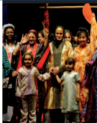
Un événement plein de couleurs et de bonne humeur !