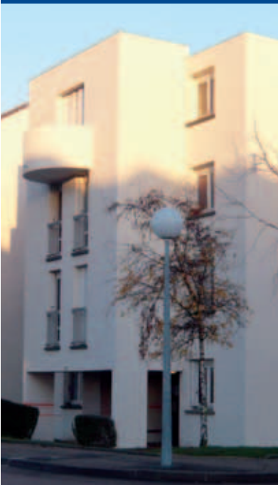
Ravalement des façades, rue Paul Fort.

La première tranche de travaux programmés dans le cadre de la rénovation urbaine de la Résidence est véritablement entrée dans sa phase opérationnelle et, désormais, des améliorations sensibles se font jour.