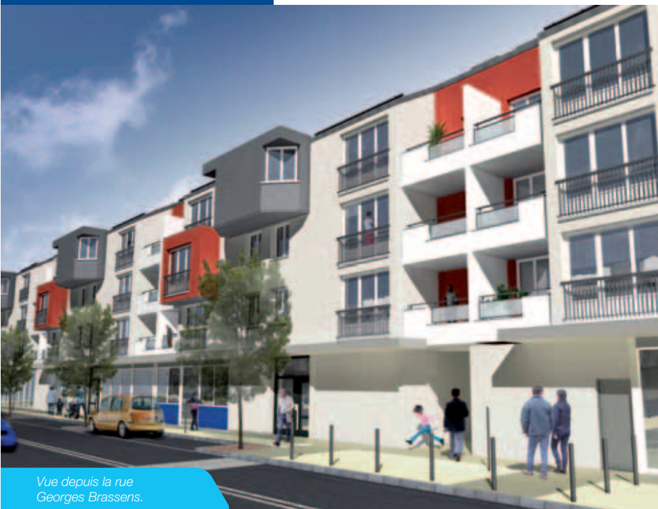
Vue depuis la rue Georges Brassens.