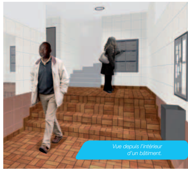
Vue depuis l'intérieur d'un bâtiment.