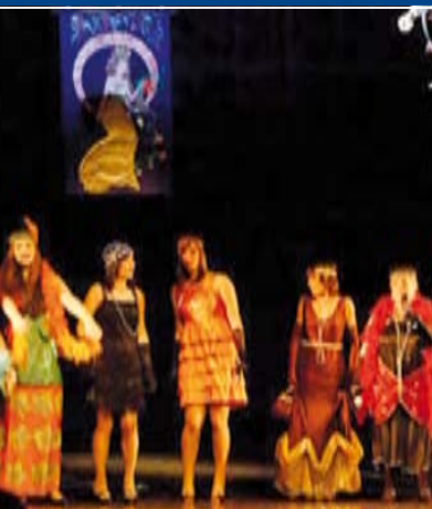
Un spectacle chatoyant offert par les « Femmes de nos quartiers ».