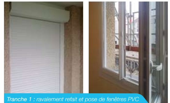
Tranche 1 : ravalement refait et pose de fenêtres PVC et volet roulant intégrés dans certains logements.

À peine les finitions sur la réhabilitation de la tranche 1 ont-elles été achevées à la fin de l'année 2009 que c'est au tour des travaux des 175 logements de la tranche 2 (immeubles principalement situés rue Georges-Brassens) de débiter. Voici en détail le programme des travaux ainsi que le calendrier prévisionnel.