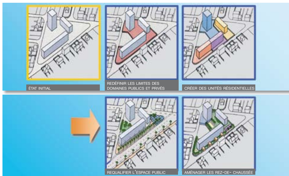
Les étapes d'une résidentialisation (document de la ville de Paris).

tes et des grilles de fermeture avec portillon d'entrée seront également posées. Les espaces privatifs de chaque bâtiment seront aussi mieux identifiés.