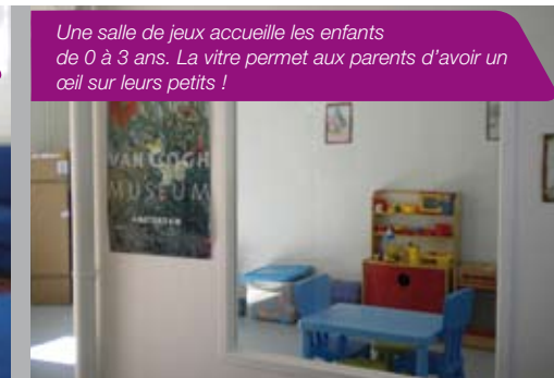
Une salle de jeux accueille les enfants de 0 à 3 ans. La vitre permet aux parents d'avoir un œil sur leurs petits !