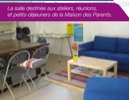
La salle destinée aux ateliers, réunions, et petits-déjeuners de la Maison des Parents.