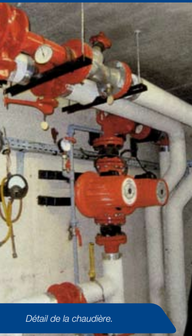
Détail de la chaudière.

La chaufferie réunissant l'ensemble des chaudières de la Cité de l'Étoile se situe au pied de la tour. De là, partent 4 gros tuyaux d'eau chaude en direction de 7 sous-stations. Dans chacune des sous-stations se trouvent des mini chaufferies qui, à leur tour, redistribuent le chauffage par cages d'escaliers.