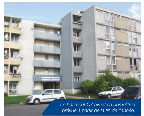
Le bâtiment C7 avant sa démolition prévue à partir de la fin de l'année.

Aucune inquiétude à avoir pour les bâtiments voisins du C7 : toutes les précautions sont prises pour que la démolition n'entraîne pas de dommages sur les autres bâtiments. En outre, chaque bâtiment a ses propres fondations. Par ailleurs, il s'agit d'une démolition « par grignotage », c'est-à-dire qui se fait avec un engin mécanique pourvu d'une mâchoire. Cette technique est adaptée aux démolitions petites et délicates. Enfin, une fois les travaux de démolition effectués, le pignon du bâtiment C6 sera rendu étanche.