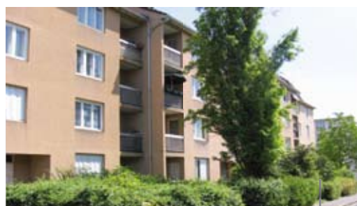
La résidence avant et après réhabilitation et résidentialisation.

Désormais, reste à mener à bien un projet de Gestion urbaine de proximité (GUP) afin de garantir la pérennité des investissements engagés et la satisfaction de tous les locataires.