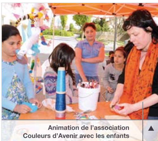
Animation de l'association Couleurs d'Avenir avec les enfants

Alors que les travaux de réhabilitation et de résidentialisation sont achevés, Emmaüs Habitat a souhaité organiser des rencontres participatives pour examiner, avec les habitants, les points positifs et les points négatifs du fonctionnement de la résidence Le Perreux. Quatre rencontres en bas d'immeubles, coordonnées par l'association Couleurs d'Avenir, se sont ainsi déroulées les 2, 4, 5 et 9 mai 2011. À cette occasion, chacun a pu exprimer ses remarques et faire des propositions concrètes concernant les espaces collectifs, le voisinage, la convivialité, la gestion des ordures ménagères, etc.